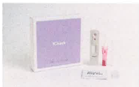
梅毒トレポネーマリスク 検査キット