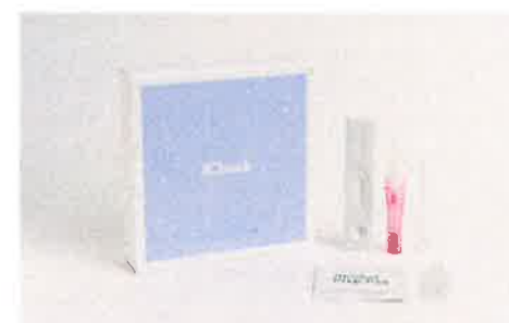
C型肝炎ウイルスリスク 検査キット