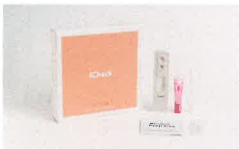
HIVウイルスリスク 検査キット