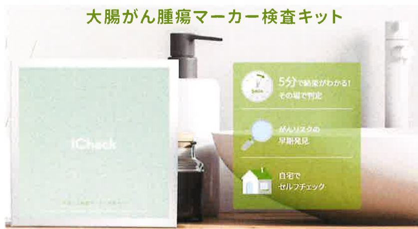
検査キットの使い方