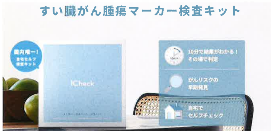
検査キットの使い方