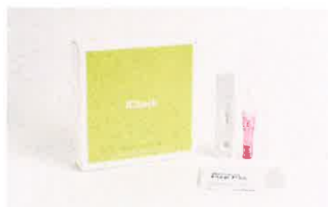
B型肝炎ウイルスリスク 検査キット